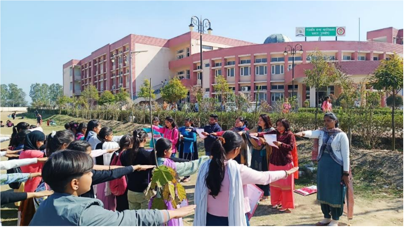
11. Under the voter awareness campaign, 80 college students took Elector's Pledge on 23/02/2024.