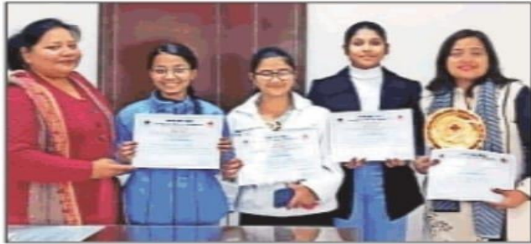
प्रतिभागी छात्राओं को प्रमाण पत्र देती प्राचार्या।